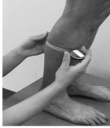
Şekil 3. Baldır ölçümü (Marangoz, 2024)