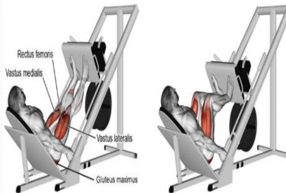
Şekil 6. Leg Press Kuvvetinin Belirlenmesi (Genç, 2024)

Kişinin bacaklarını kullanarak bir ağırlığı veya direnci öne doğru ittiği karmaşık bir ağırlık antrenmanı egzersizidir. Bu egzersizi yapmak için kullanılan ekipmana "bacak pres makinesi" denir. Bir sporcunun alt vücudunun (diz ekleminde uyluklara kadar) genel gücünü artırmak için kullanılabilir. Squatlar güç kazanmanıza yardımcı olabilir. Doğru yapıldığında, daha ağır serbest ağırlıkları kaldırmak için dizlerin gelişmesine yardımcı olabilirler. Bacak preslerinin faydaları genellikle alt vücut kaslarını (quadriceps, hamstringler, gluteus maximus) etkiler (Koca, 2020; Rosch vd., 2000).