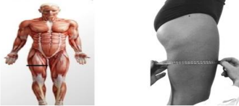
Şekil 2. Uyluk ölçümü (Marangoz, 2024).

Bacak Kütlesi = Uyluk Kütle Toplamı + Baldır Kütle Toplamı + Ayak Kütle Toplamı