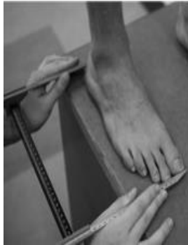
Şekil 5. Ayak uzunluğu ölçümü (Marangoz, 2024).