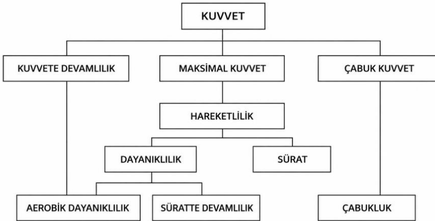
Şekil 1. Kuvvet türleri ve ilişki düzeyleri (Sevim, 1992).

Antrenman düzeyleri aynı, vücut kitlesi farklı büyüklükte olan farklı sporcuların geliştirebildikleri kuvvete relatif kuvvet denilmektedir. Örneğin, 70 kg'lık bir sporcu ile 60 kg'lık bir sporcunun aynı süre ve yöntem ile geliştirebildikleri kuvvet miktarı farklı olmaktadır (Günay vd., 2019). Bu kuvvet türü vücut ağırlığına büyük ivmeler vermeyi gerektiren spor branşlarında başarımın belirleyicisi olabilmektedir (Açıkada ve Ergen, 1990). Relatif kuvveti geliştirebilmek için yağ külesinin azaltılması ve maksimal kuvvetin artırılması gerekmektedir. Salt kuvvet için ise, kas külesinin büyümesi ve koordinasyonun geliştirilmesi şarttır. Fakat sadece kas külesini artırıcı çalışmaların yapılması kilo artımına sebep olacaktır. Kas içi ve kaslar arası koordinasyon çalışmalarının yapılması ise, kilo artışı olmadan nöromüsküler sistemle iş birliği yaparak relatif kuvvetin gelişime yardımcı olacaktır (Günay vd., 2019).